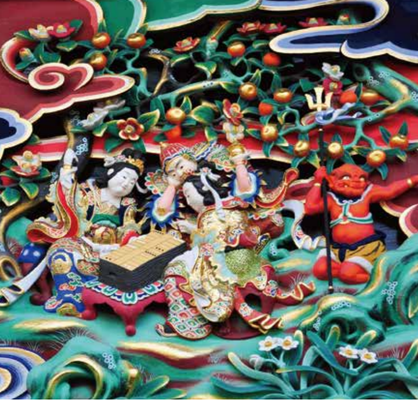
きちじょうてん べんざいてん ずごらく 吉祥天と弁財天が双六をしている様子。神様が人々を救うために奔走することなく遊んでいる、平和な世であってほしいという願いが込められているという