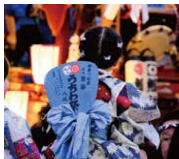
祭り期間中に配布されるうちわ