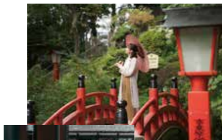
境内を散策して 歴史を感じる

聖天様の門前、縁結び通りは昔ながらのレトロなお店が並ぶ商店街で、毎年4月と10月には手づくり市が行なわれ、多くの人でにぎわいます!また、仁王門の左右に立つ金剛力士像は、熊谷市内でよく見かける防犯ポスター「監視の目」のモデルとなっています!