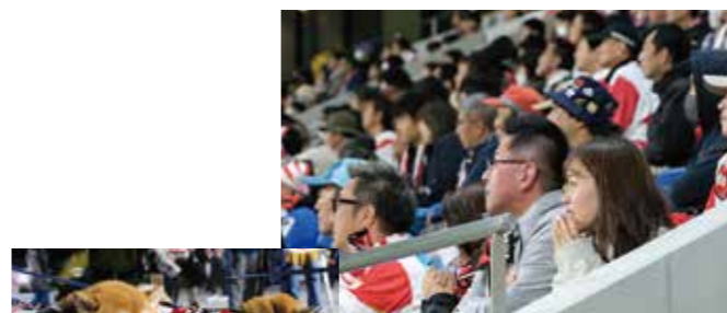
熊谷ラグビー場で行われた ラグビーワールドカップ 2023フランス大会 パブリックビューイング