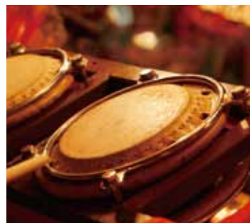
締太鼓の音が鳴り響く

治の頃に料亭「泉州楼」の主人が、祭りの期間中に振る舞っていた赤飯に代わり、洗うちわを配布したことにあったと語り継がれており、その後、各町競って山車・屋台を購入・製作し、神輿渡御と巡行による現代のうちわ祭の原型が確立された。 山車・屋台は、巡行中に他町区と出会えば、互いに囃子の腕を競い合うよう、笛・鐘・太鼓の「叩き合い」が行なわれる。全町区そろっての叩き合いは毎夜場所を変え、最終日には、全12台の山車・屋台がお祭り広場に集結し、「曳っ合せ叩き合い」「年番送り」が行われる。盛夏の夜空に響く勇壮なお囃子は、見る人皆の心を熱くさせてきた。