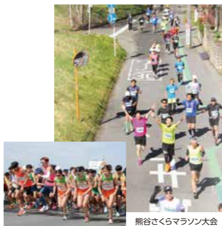
熊谷さくらマラソン大会

スポーツの力で まちににぎわいを 熊谷市には、本拠地・活動拠点を置くプロスポーツチーム等が4チームあることはご存じだろうか。男子ラグビーの「埼玉パナソニックワイルドナイツ」、女子ラグビーの「アルカス熊谷」、女子サッカーの「ちふれASエルフェン埼玉」、プロ野球の「埼玉武蔵ヒートベアーズ」の4チームが、ここ熊谷市を拠点にそれぞれ活躍している。 プロスポーツ選手等のプレーを生で観戦することは、迫力や緊張感を直接体感でき、会場の熱気や観客との一体感を楽しむことができる。ぜひ、スタジアムで選手たちのダイナミックなパワーを感じていただきたい。 また、熊谷市には陸上競技場、ラグビー場、野球場、サッカー場、テニスコート、公園やジョギングコースなどの豊富なスポーツ施設がそろっていて、市民もスポーツを楽しむことができる。そのほかにも、熊谷さくらマラソン大会や熊谷めめま駅伝などの参加型イベントもあり、誰もが自分のペースでスポーツを楽しむことができることも魅力のひとつだ。