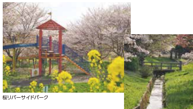
桜リバーサイドパーク