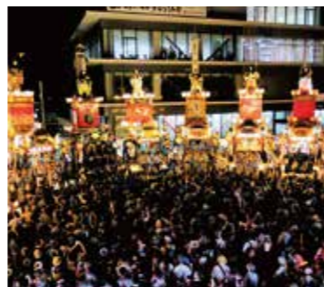
扇形に並んで叩き合い