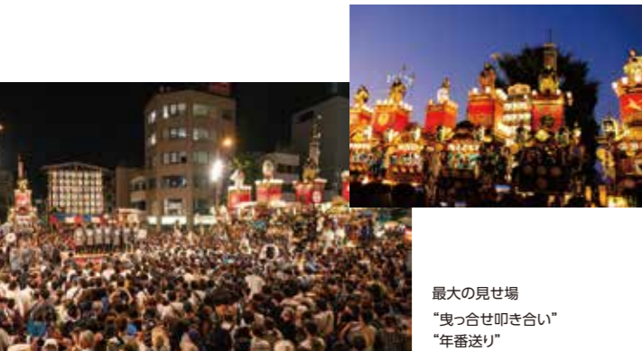
最大の見せ場 「曳っ合せ叩き合い」 「年番送り」