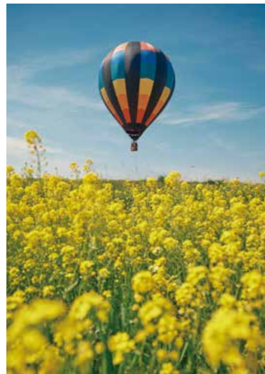
熊谷さくら祭 熱気球搭乗体験

早咲きの桜として知られ、テレビでも紹介される石上寺の熊谷桜や、旧熊谷堤万平公園の桜など、市内には多くの桜の名所があります。散策にぴったりの小江川1000本桜（江南地区）や、お子さま連れには桜リバーサイドパーク（大里地区）もおすすめです。熊谷さくら祭の期間はぜひ長く滞在して、桜巡りを楽しんでください！