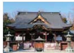
中門、貴惣門とソメイヨシノ