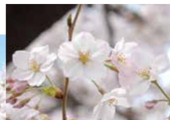
およそ2kmにわたって 約500本咲き誇るソメイヨシノ