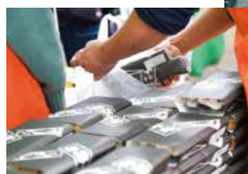
例年11月に開催される熊谷市産業祭

「100年フード」って？ 文化庁では、地域で世代を超えて受け継がれてきた食文化を、100年続く食文化「100年フード」と名付け、文化庁とともに継承していくことを目指す取組を推進しています。