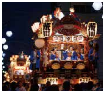
巡行して行宮を参拝