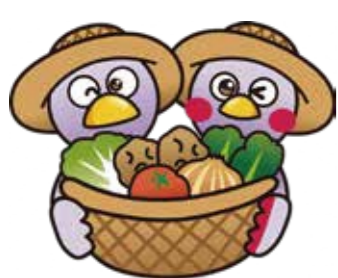
埼玉県マスコット「コバトン」「ざいたまっち」

※車にて来場する場合、交通渋滞、駐車場不足が予想されますので、公共交通機関等のご利用をお願いいたします。