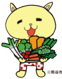
熊谷市マスコットキャラクター「ニャオざね」