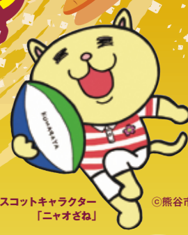
熊谷市マスコットキャラクター「ニャオざね」