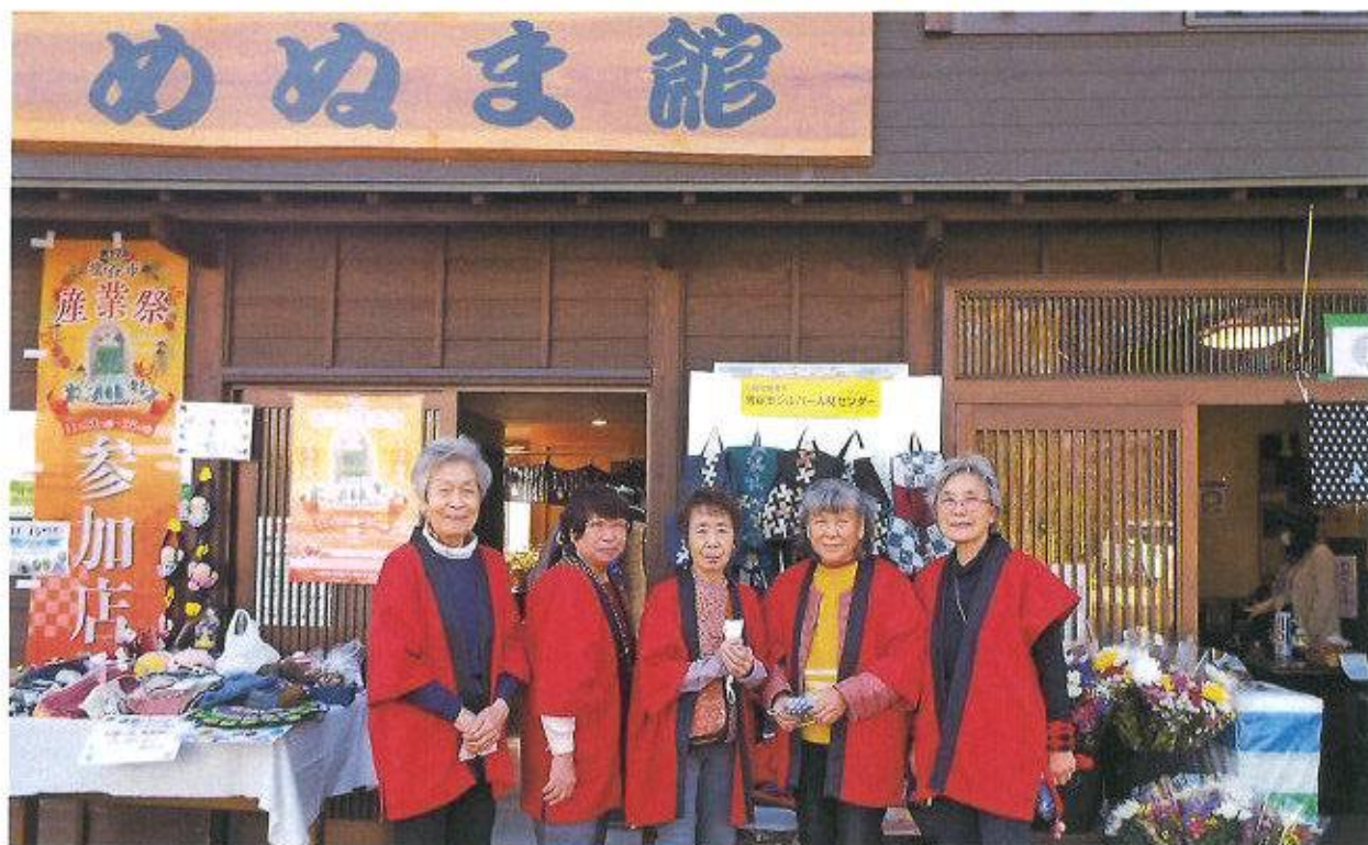
第17回 熊谷市産業祭 手芸サークル参加