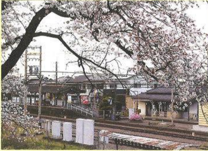
「田舎駅 (秩父線大麻生駅)」 第7地区 田口 徹男