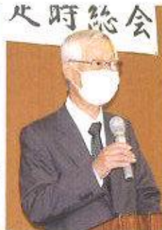
篠田副理事長 開会のことば