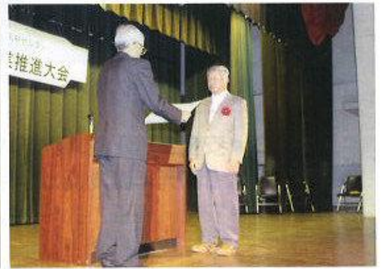
最優秀賞表彰 おめでとうございます