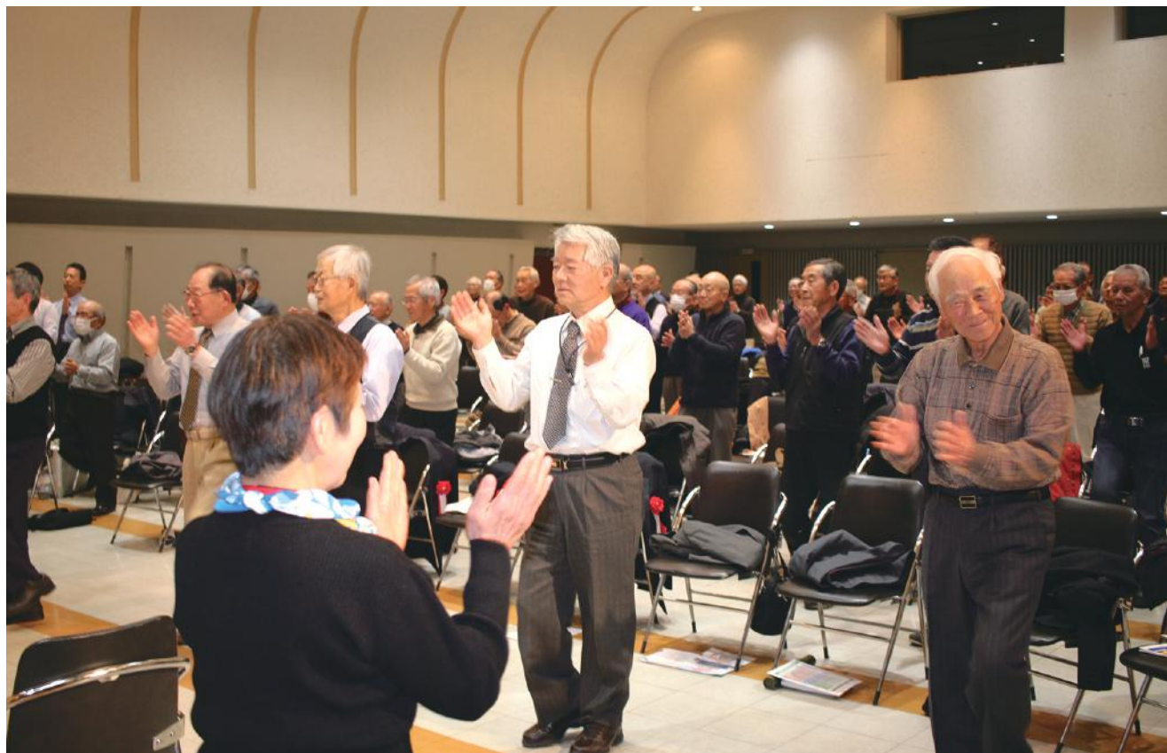
安全・適正就業推進大会 ※フレイル予防体操