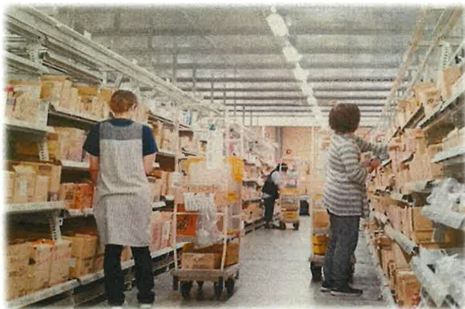
倉庫内ピッキング作業